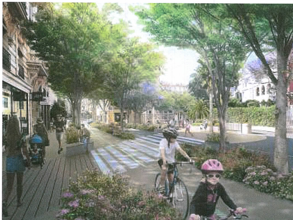
(Infographie Ville de Nice)

FACE AUX LECTEURS Les secrets gourmands de Mercotte P 54-55